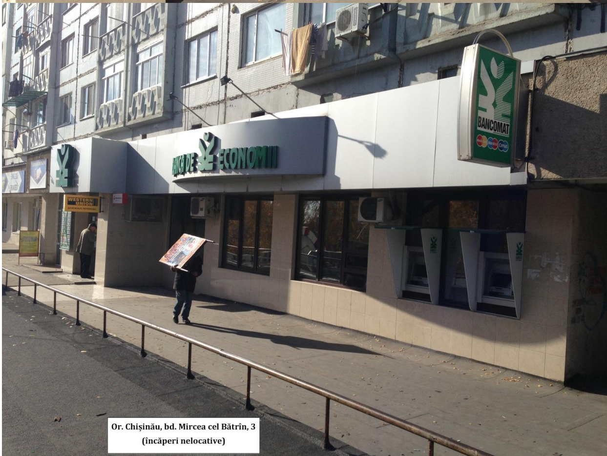
Or. Chișinău, bd. Mircea cel Bătrîn, 3 (încăperi nelocative)